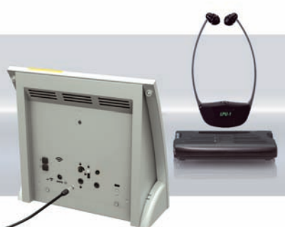
Le récepteur de boucle magnétique LPU-1, réf. A-4276-0 (station de charge, réf. A-4977-0), offre une réception claire directement à l'oreille pour les personnes présentant une déficience auditive et qui ne portent pas de prothèses.

Idéal dans toutes les situations où la discrétion et la confidentialité sont requises. Grâce au combiné, les personnes non appareillées ou malentendantes peuvent également profiter de la cette fonction.