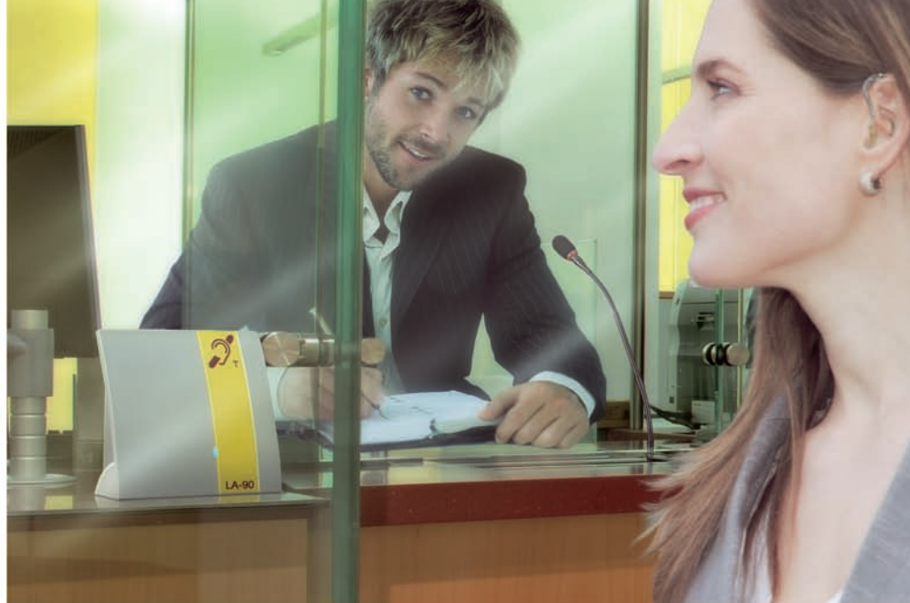
Ecoute inductive par prothèse ou récepteur de boucle magnétique.

Le « LA-90 » permet de raccorder un microphone externe en complément du microphone interne. D'où une plus grande liberté de mouvement entre l'orateur et l'auditeur.