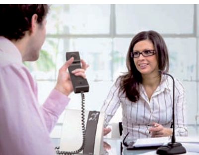
Le «LA-90 SET» : Grâce au combiné, les personnes ayant une perte auditive légère peuvent également bénéficier d'un accueil discret.