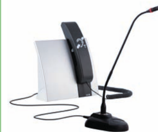
« LA-90 Set » réf. A-4211-0